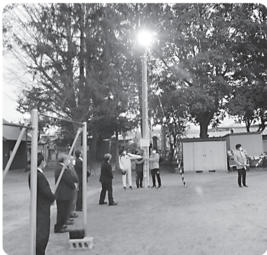
サポート基金による照明灯

最後に本年度の本部同窓会総会は8月8日(日)に大崎市古川の「グラウンド平成」で開催予定ではありますが、新型コロナウイルスの感染状況によっては、中止せざるを得ないことも予想されます。総会実施可否につきましては、同窓