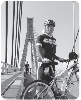
インドネシアへの自転車ツアー

一転職の経緯 1985年に新卒社会人として会社勤めをスタートさせ、最初の会社に8年間、次の会社に25年間勤務しました。前職では55歳になると部下なしの役職となり、55〜59歳までは基本給料は同じですが、60歳になると、給料が1/3になります。 自分の周りの先輩たちがそうなるのを目の当たりにすることがだんだん増えてきて、その人たちの仕事も最前線とはいえない仕事になってきます。60歳を迎えてしまっただけで、給料が1/3になってもそのまま会社におろ下がるしか選択肢がなくなります。60歳になる前の50代半ばのうちに機会があるのであれば、会社を乗り換えることで、生涯年収を向上させることができるのではないかと、そう考え、チャンスを探ることにしたのが2018年の春頃でした。 たまたま、社会人になってからもずっと交流が続いていて、都市銀行から小売業に転出し、役員をやっている大学の同級が近所に住んでおり、いろいろ話を聴く機会がありました。 その中で、たまたま、「シンガポールの会社に出資したのだが、その後業績が急激に悪化しているが、現在日本から送っている人材では状況を打開できないため、代わりに送り込める海外営業ができる人材を探している。ただ、そういう即戦力の人材は、給料水準が高く、今の自分の会社の給与水準と合わないの、確保できておらず、人事担当役員として苦慮している」との話が2回ほどありました。 その話を最初に聞いた際は、他人事としてとらえていましたが、話を聞いた限り、自分でもできるような気がしてきました。自分は海外勤務経験こそないものの、海外関係業務の経験が約15年ほどあったため、なんとかいけるのではないかと思われました。 ある時、「それなら、自分がその役割で行くとしたらどうなんだ?」と友人に投げかけたところ、