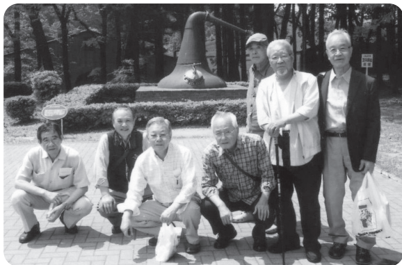
同期生らと（左から2番目筆者）

かけられました。前年、正月のある新聞の社説で、「人生90年時代が近い今、75歳未満の前期高齢者―ヤングオールド―団塊の世代、その活力を埋もれさせる手はない」とし、新しい地域力を創造し、その担い手となることを期待したいとあり、我々への「ハッパ」に聞こえました。