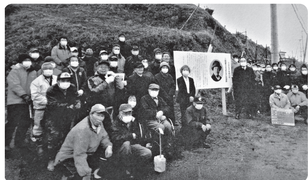
雨の心配もありましたが大勢で除幕を祝いました

があります。銘板は縦1m、横2mの大きさで、顕彰する会設立以来の念願でありました。