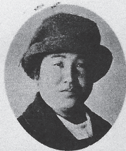
日本女子体育の母 二階堂トクヨ先生の住居跡

最近の活動としては、会報「トクヨ通信」の発行に加え、「二階堂トクヨ先生の住居跡銘板設置」