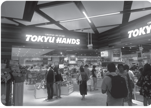
東急ハンズも進出

二シシガポールでの仕事 出向したシシガポールローカル企業は、インドネシアの大口の小売先を失ってからは、坂を駆け落ちるように業績が悪化しており、ピーク時と比較して売上規模が1